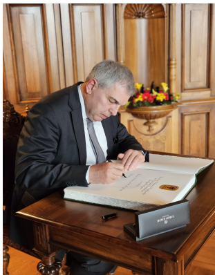
Le Président du Bundesfinanzhof