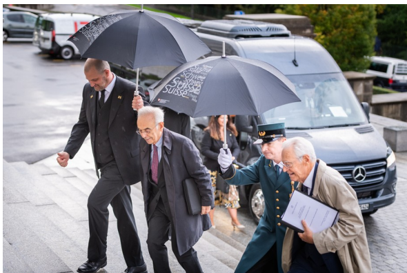
Ankunft der beiden Vizepräsidenten des italienischen Verfassungsgerichtshofs